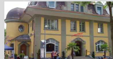
Das «Milano Nord» birgt einige Besonderheiten als gutbürgerliches Wohnhaus.

Vor 100 Jahren wurde das «Uhlmannhaus» erbaut. Zwei Führungen unter kundiger Leitung entführen in die Innereien dieses Stücks Sozial- und Architekturgeschichte. Platzzahl beschränkt.