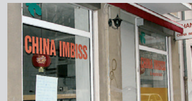
Warum sind Imbisse hässlich? Gehört es zum Konzept? Oder schauen wir falsch hin?