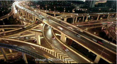
«The Human Scale» stellt die Frage nach der Massstäblichkeit unserer gebauten Umwelt.

Dienstag, 10. März, 1800 Hauptversammlung Gemeinschaftsraum Siedlung Fink