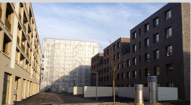
Wie geht Burgdorf die Transformation der Industrieareale AEBI oder Schwob-Schmid an?

Mittwoch, 29. April, 1830 Wie geht Burgdorf die Transformation von Industriearealen an? Treffpunkt AEBI-Kreisel