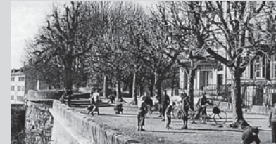
1941 (Bild) spielte und promenierte man auf der Grabenstrasse. Was soll 2041 sein?

Die ehemalige Stadtbefestigung und Promenade fristet ein wenig erbauliches Dasein als Parkplatz. Soll das weitere 100 Jahre so gehen oder haben wir Lust auf eine andere Nutzung? Heinz Sägeser lanciert die Diskussion.